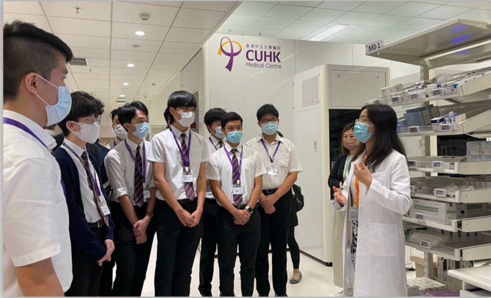
參觀香港中文大學醫院