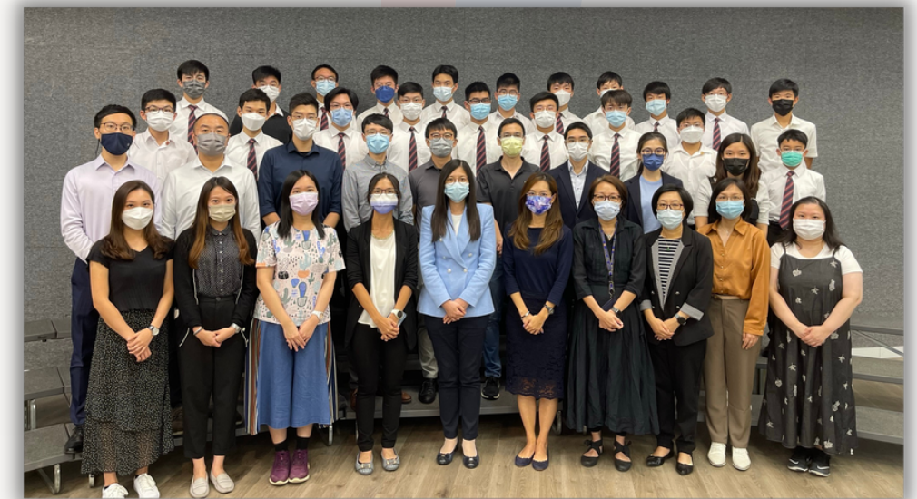
升學輔導大使及輔導員