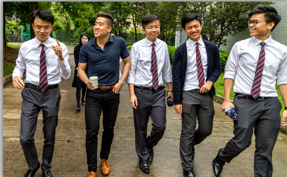
與耶魯大學招生人員一同參觀學校